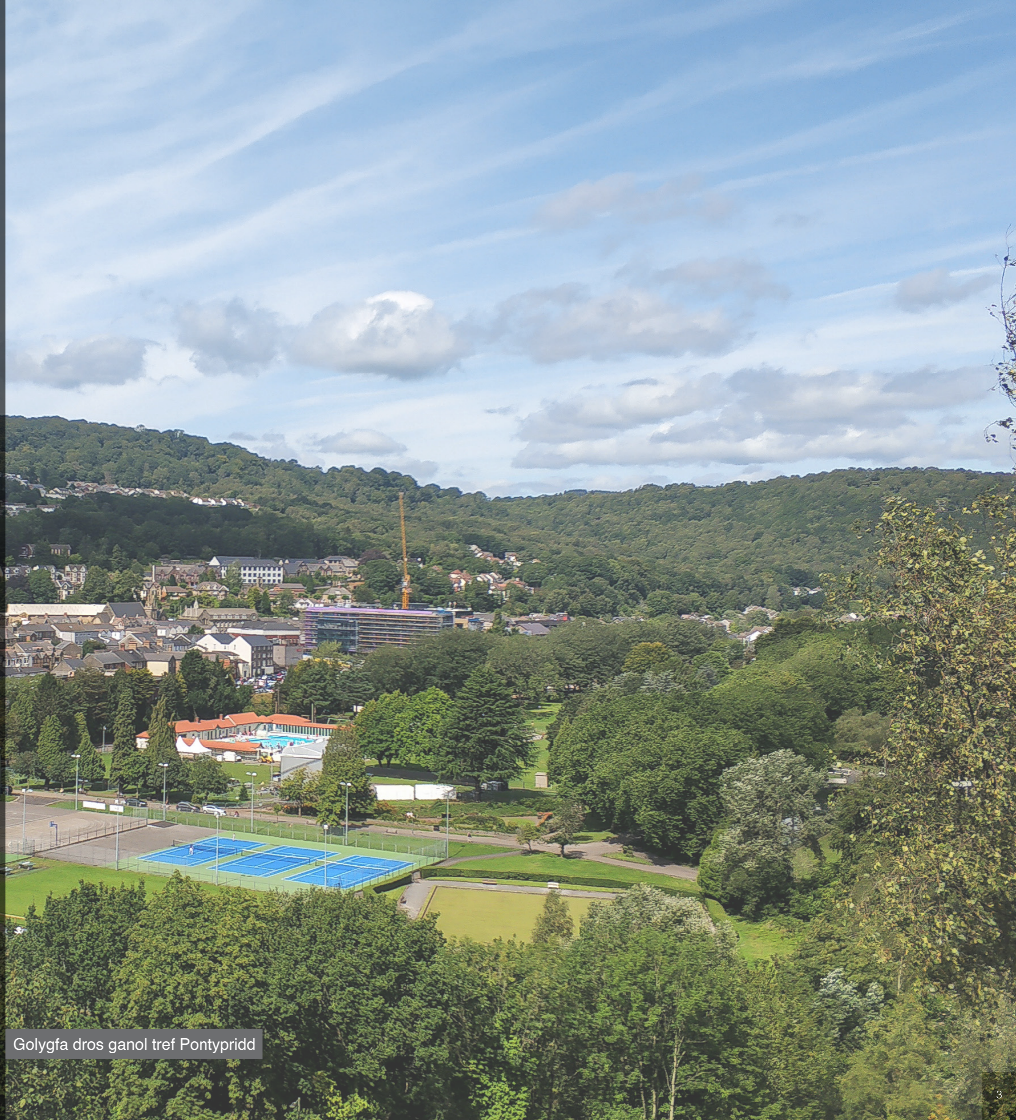
Golygfa dros ganol tref Pontypridd

Porth y De yw'r ardal gyntaf y mae pobl yn ei gweld wrth ddod i mewn i'r dref o'r de, gan gynnwys o orsaf drenau Pontypridd, sy'n orsaf allweddol yng nghynllun Metro De Cymru. Mae trawsnewid yr ardal felly yn rhoi'r cyfle i greu ymdeimlad amlwg o gyrraedd sy'n unigryw i Bontypridd. Dyma gyfle i groesawu pobl i'r dref, gwella ei hadeiladau hanesyddol hardd ac agor y dref i'w lleoliad ar lan yr afon a ger y parc.