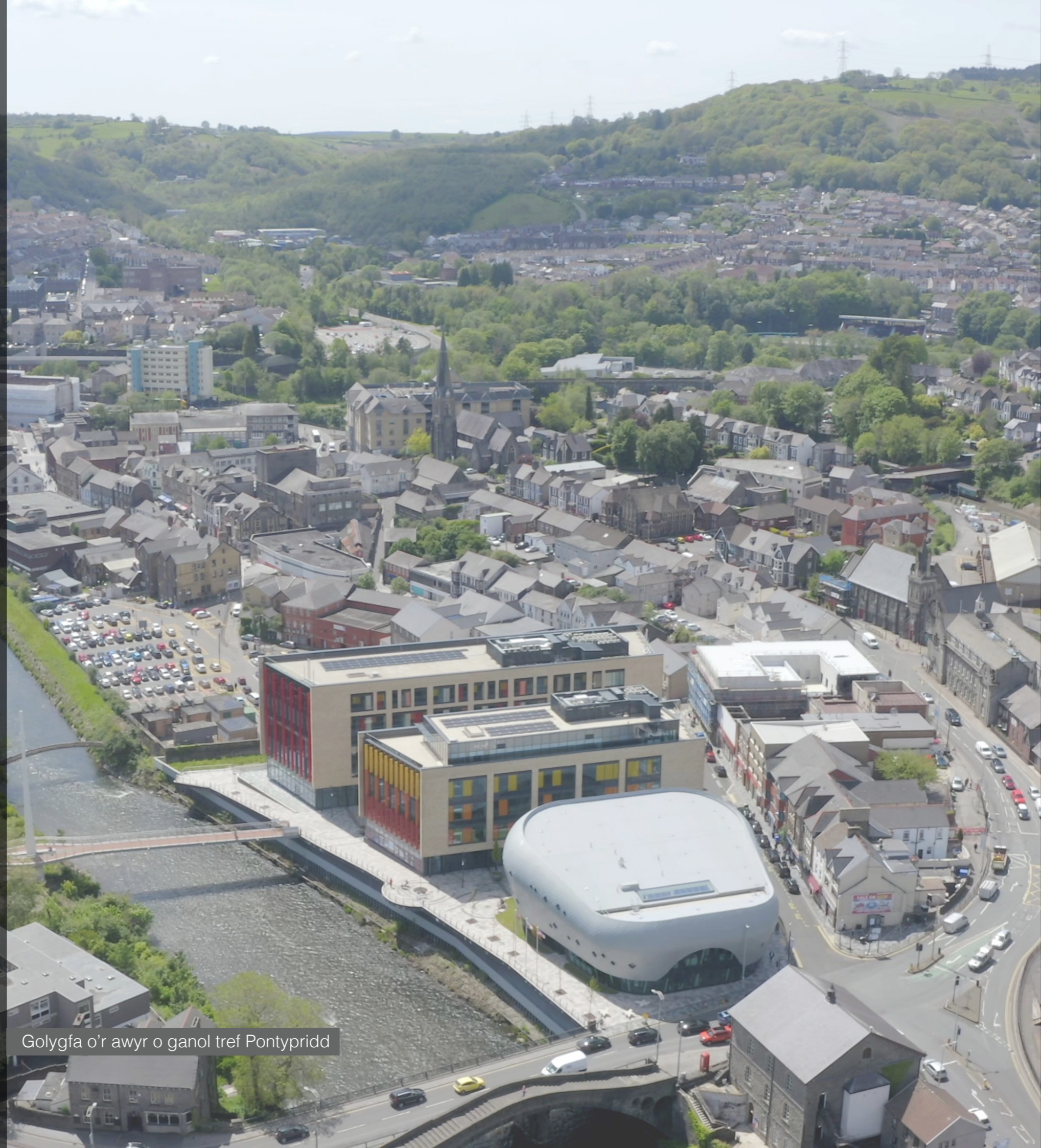
Golygfa o'r awyr o ganol tref Pontypridd

Mae ardal Porth y De yn gyfle strategol i ddechrau cyflawni'r Cynllun Creu Lleoedd ar raddfa fawr, gan greu momentwm sylweddol a all barhau â thwf sylweddol y dref.